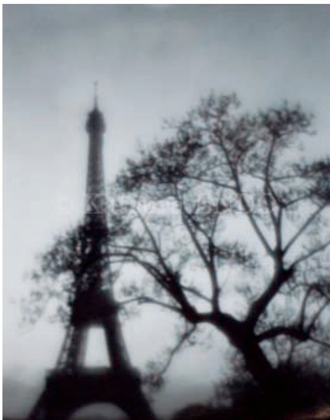
la Tour Eiffel 2010

—私は天命の仕事写真家としてフィルムにその感動をおさめ続けたい。時の記憶とならんがために。