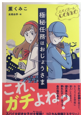
第2巻 スパイガールGOKKO ～極秘任務はおじようさま～ (2019年11月発行)