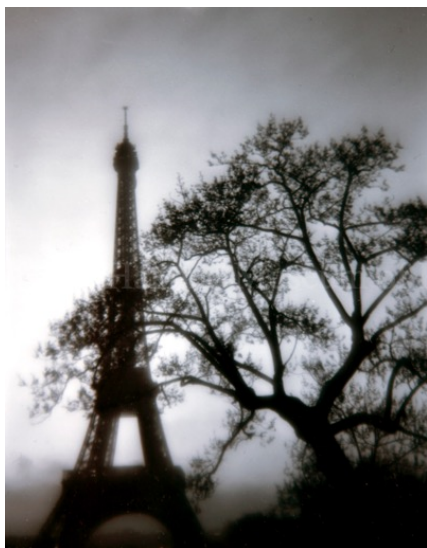
La Tour Eiffel à l'aube 明け方のエッフェル塔 写真、ゼラチンシルバープリント、フォトアクリル