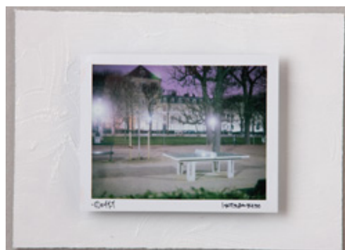
Jardin Marco Polo #014