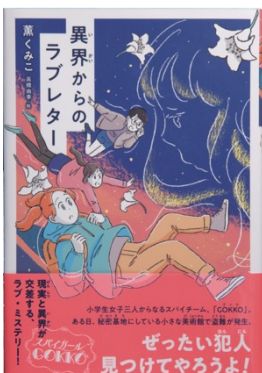
第3巻 スパイガールGOKKO ～異界からのラブレター～ (2020年5月発行)

スパイにあこがれる小6の女の子3人組が、箱根を舞台に大活躍! 少女から大人になる途中のきらめきや、アンバランスな心情を巧みに描き、思春期の読者を熱狂させてきた薫くみこが、久々に「12歳」を描く。とびきり活きのいい書き下ろしエンターテインメント小説! 薫くみこ 作 高橋由季 絵 定価: 本体1300円 (税別) 発行元: ポプラ社