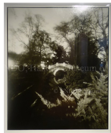
Parc de Monceau モンソー公園 写真、ゼラチンシルバープリント