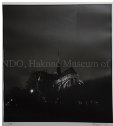
Cathédrale Notre-Dame de Paris ノートルダム大聖堂 写真、ゼラチンシルバープリント