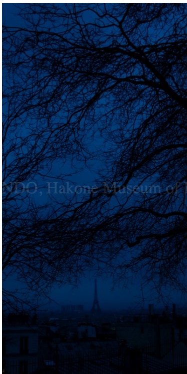
遠藤桂 巴里「紺碧に佇むエッフェル」 1200×600mm、ED25 写真、Fine Art Paper Digital Print