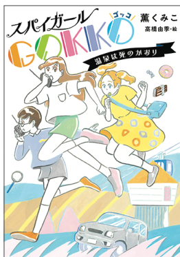
第1巻 スパイガールGOKKO ～温泉は死のかおり～ (2018年8月発行)

児童文学作家 薫くみこ作 スパイガール GOKKO ポプラ社より全3巻発行! 全国書店にて発売中。箱根写真美術館ショップでも販売しています。