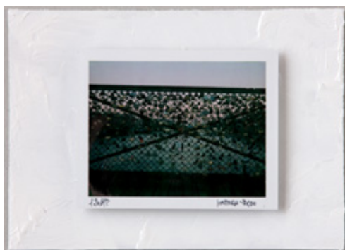
Pont des Arts #009